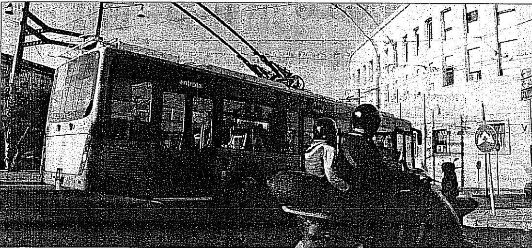
Il filobus durante il collaudo dei giorni scorsi da parte della commissione ministeriale