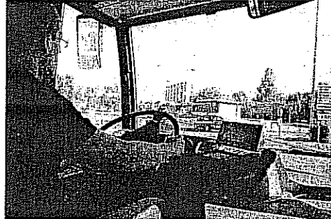
LE PROVE Sui mezzi della flotta 3

Questo riguardo i tempi. L'altra nota dolente sono i costi. «La spesa totale ammonta ad oltre 25 milioni di euro» viene evidenziato nella diffida, «dei quali 13 milioni 210mila e 197 a carico del Ministero delle Infrastrutture; tre milioni e 600mila e 900 euro a carico della Regione; otto milioni ed 011mila e 787 euro a carico del Comune. Questi ultimi sono stati coperti mediante un mutuo, con-