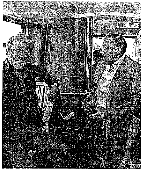
A sinistra Tanza e sopra il presidente (a destra) Peyla sul filobus

finale in cui manca solo l'ultima benedizione dal Ministero». Poi aggiunge: «Si vuol far polemica distruttiva e far fallire il Comune che deve dar in-